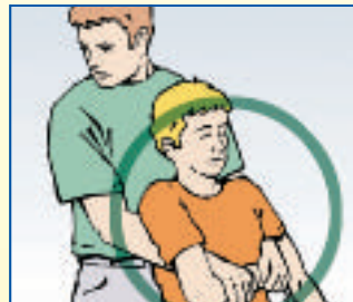
Person ggf. aus dem Gefahrbereich retten